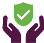
Konstruktionslösningar och byggheter