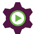
Ökad kompetens och attraktivitet