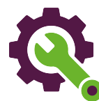
Tillståndsbedömning, drift- och underhållsmetoder