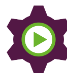
Ökad kompetens och attraktivitet