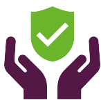
Konstruktionslösningar och byggmetoder