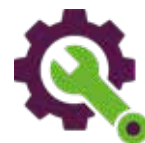
Tillståndsbedömning, drift- och underhållsmetoder