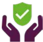
Konstruktionslösningar och byggmetoder