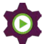
Ökad kompetens och attraktivitet